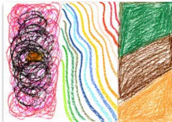
Praxisbeispiele: Erwachsener 1 Konfusion 3 Mittelweg 2 Struktur

keitsfokussierungen und den Umgang damit entwickelnde Wahrnehmungsfähigkeit wirkt sich konstruktiv auf den Aufbau und die weitere Entwicklung einer professionellen Identität aus, welche in pädagogischen Kontexten eines der wichtigsten Werkzeuge darstellt.