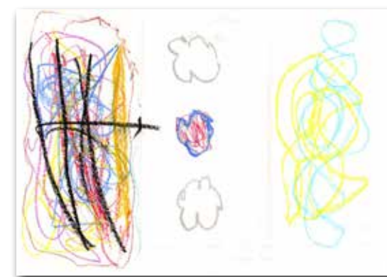
Praxisbeispiele: Kind 1 Wut 3 Freudewolken 2 Erleichterung

Ergebnisse dieser Prozesse sind ein präsenes und authentisches Verhalten, sowie ein klares und kreatives Intervenieren, ebenso ein Zuwachs von innerer Ruhe und Gelassenheit.